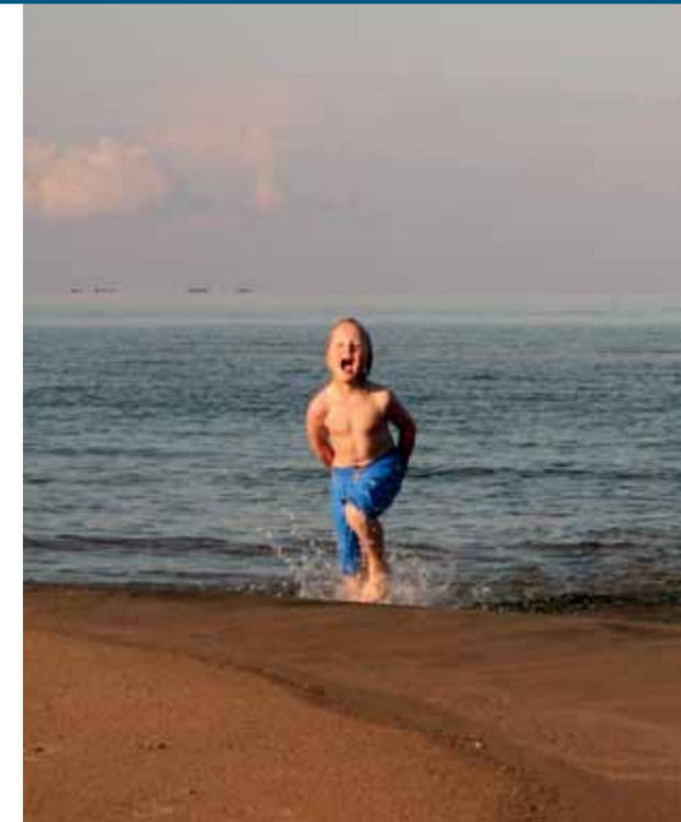
Salta bad – vad kan vara bättre?