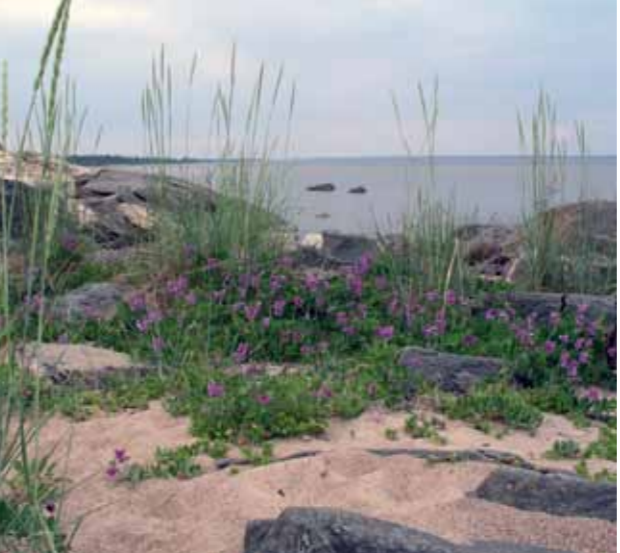
Strandråg ( Leymus arenarius ), strandvial ( Lathyrus japonicus ) och saltvar ( Honckenya peploides ).

Fisket började vid midsommar och fortsatte in på hösten. Hela familjen deltog i det tidsödande arbetet med att ta hand om fångsterna. Fram till första världskriget var fiskaren hänvisad till att ro eller segla och transporten av fångsten tog lång tid. Därför placerades stugan så nära fiskegrynnorna som möjligt. Det var kvinnornas uppgift att sedan ro eller segla in till staden med fisken.