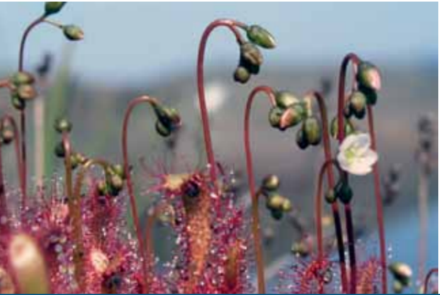
Storsileshår ( Drosera anglica ) äter helst kött till middag.

I de vattenfyllda fördjupningarna, hållkaren, lever bara speciella växter som tål uttorkning och omväxlande temperatur. Grodyngel och den köttätande växten sileshår trivs i hållkaren. Sileshårets blad är omtalade som farliga insektsfällor. På bladen sitter långa, vackert purpurrodda körtelhår som har både känsel och rörelseförmåga. Körtelhåren avger ett segt slem som insekter fastnar i. Bladet rullar ihop sig kring bytet och enzymer löser upp insekten. Näringsämnen tas sen upp av växten. Sileshår användes förr till att göra så kallad tätmjolk eller filtåta. Man gned in kärlet med sileshår och hällde i spenvarm mjölk som fick tjockna till fil. Sileshår var även verksam för att ta bort värtor och liktornar.