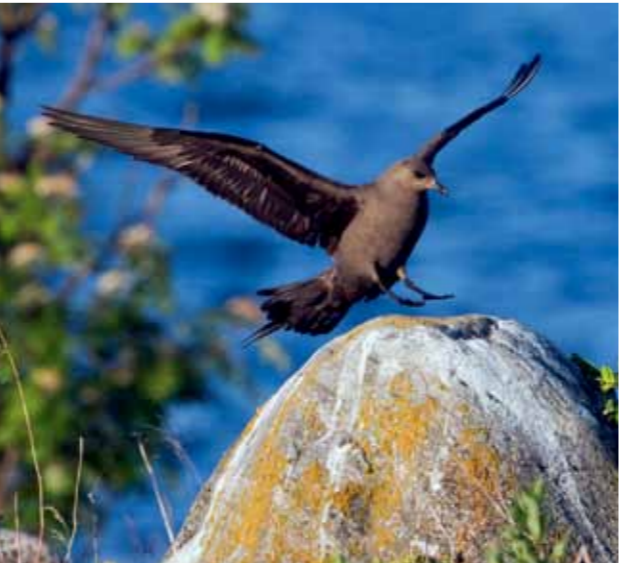
Labben ( Stercorarius parasiticus) är en duktig flygare som ibland kallas för Elof eller Svartasse.

Gustaf Daléns uppfinning, AGA-fyren, stod här på 1940-talet. Tillsammans med den andra AGA-fyren längst ut på vågbrytaren utgjorde dessa en upplyst ledmarkering för säker insegling i hamn. I början på 1900-talet var AGA-fyren en helt ny typ av fyrbelysning. Tekniken att med acetylenagas framställa fyrens blixtljus gjorde att fyra runda lysa i månader utan tillsyn. Dalén konstruerade även en sinnrik "solventil" med vilken fyren tändes automatiskt vid mörkrets inbrott. AGA-fyrarna på Stor-Räbben avvecklades i slutet på 1950-talet av Sjöfartsverket.