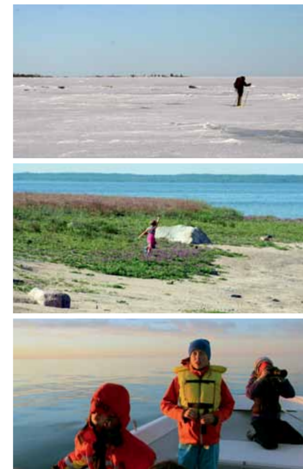
På upptäcktsfärd i Stor-Räbbens natur.