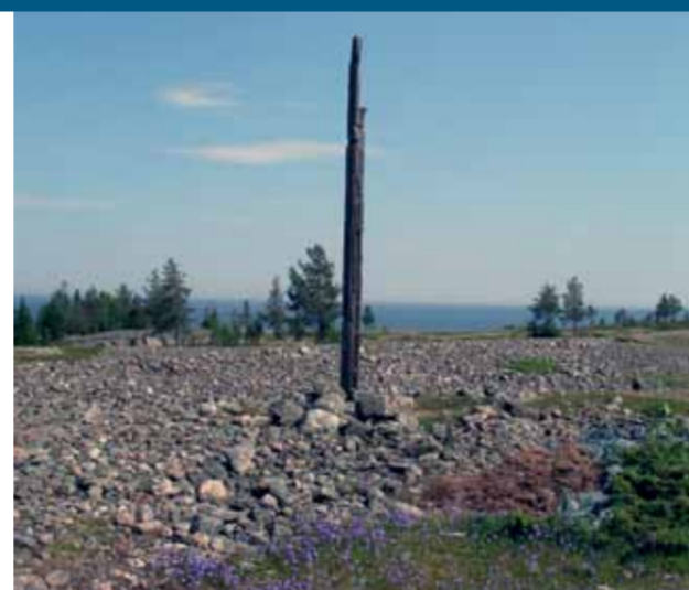
Lanternin, klapperstensfält och därefter Finland nästa...

Rinnarhällan är en forna tiders rutschkana för barnen. Här åkte man på flata stenar och även byxbakar. Det senare var ej så populärt bland mammorna på ön. Prova själv!