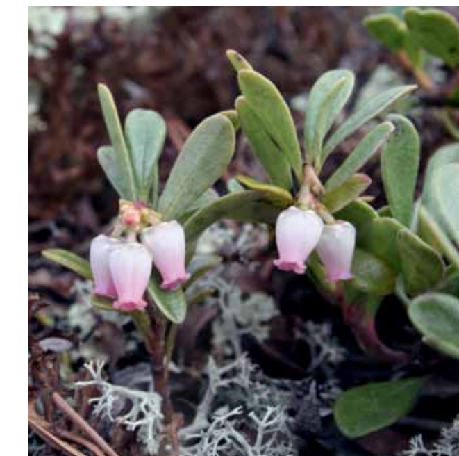
Mjölon blommor och frodas på stentorget.

Regn som faller rinner rakt ner i hålrummen mellan stenarna och bara torktåliga växter kan växa här. På många av stenarna växer gulgröna kartlavlar (Rhizocarpon geographicum). Kartlaven växer ytterst långsamt, mindre än 0,5 mm per år. De större lavarna är många hundra, kanske 1 000 år gamla. Lavar är speciella. De består av två olika organismer som lever tillsammans i symbios. I kartlavens fall är det en svamp och en blågrön bakterie som tjänar på att vara sambo med varandra.