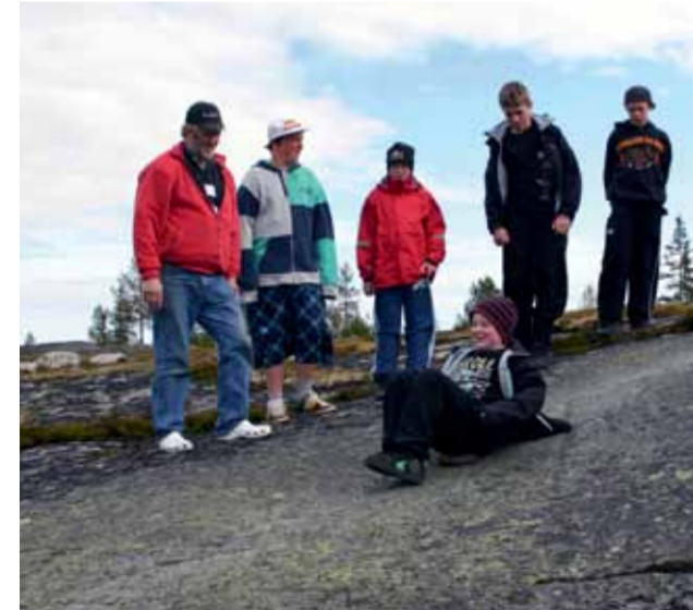
Havsörnen fiskar längs Stor-Räbbens stränder. På Rinnarhällan blir det bra fart i backen!