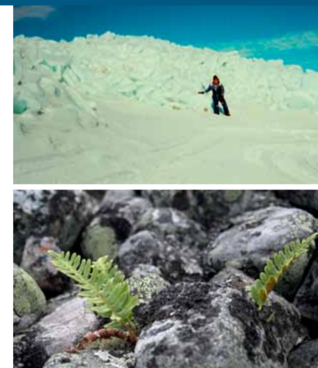
Isberg på Stor-Räbbens utsida. Den torktåliga stensötans rötter har smak av lakrits.