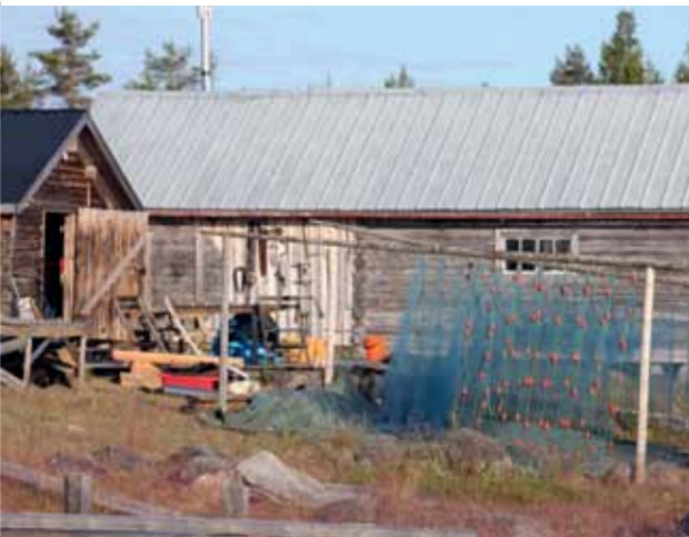
Nummerhällans äldsta vattenståndsmärke från 1750, den unika tuffagglomeraten och fiskenät på tork.