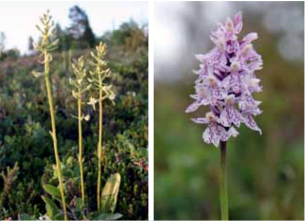
Den underbart väldoftande nattviolen, jungfru Marie nycklar och tranbär i full blom.

Under det säsongsvisa fisket fick de djur som inte togs till fåboden eller sommarladugården följa med till fiskeläget. På Stor-Räbben var det vanligt att man hade getter som gav mjölk till dem som hela sommaren bodde ute på ön. Getterna betade på hedmarken och i strandkanten och höll på så vis landskapet öppet. Getstigen användes förr, flitigt, av både sommarboende getter och människor när de färdades över ön. Det vackra hedlandskapet är fortfarande öppet. Där växer bärris av olika slag och känslan när man vandrar över heden för tankarna till fjällhedens vegetation. På sommaren fylls heden av väldofterna från de blommande orkidéerna nattviol ( Platanthera bifolia ) och jungfru Marie nycklar ( Dactylorhiza maculata ) som växer vid stigen. Lusuddstjärnen alldeles intill Getstigen är en havsvik som genom landhöjningen tappat kontakten med havet. Blommående näckrosor bildar i juli månad ett vackert täcke över tjärnens vattenyta.