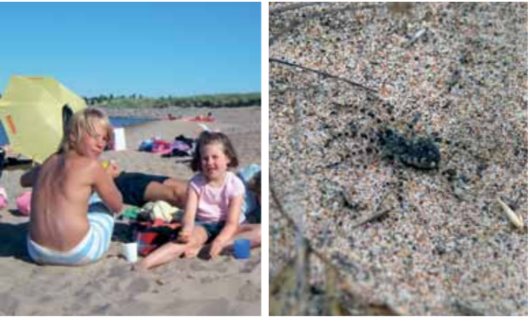
Besöksöta är giftig men havtorn är världens vitamin! Svarthällans strand uppskattas av badvänner och sandspindlar.