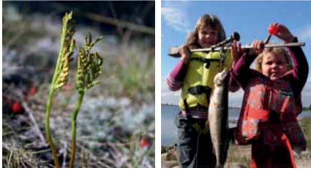
Gistgårdar. Höstläsbräken och storfiskare.