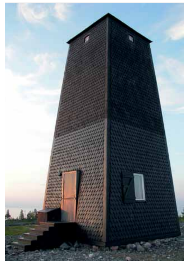
Båken – landmärke, lotsutvik och spaningsplats för försvaret under kalla kriget.

På Stor-Räbbens karga och vindpinade marker växer det ibland kjolgranar, eller krypgranar som de också kallas. Du står nu vid den första av tre krypgranar som finns nära stigen upp mot båken. Naturen anpassar sig här till det hårda vädret och träden växer inte uppåt utan längs med marken. Grangrenar som får kontakt med marken kan slå rot och bilda så kallade avläggare. Krypgranar kan på så vis överleva som en klon och blir mycket gamla. 608 årsringar kunde man räkna på en meterhög krypgran på kalfjället Storsnasen i Jämtland. Om krypgranen får ett vindskydd genom uppväxande skog nära intill börjar granen växa uppåt som en helt vanlig gran.