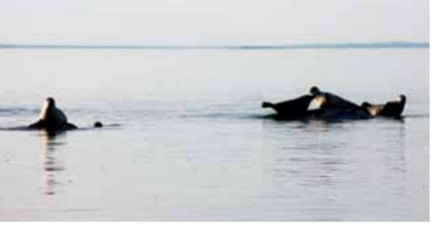
Grodyngel simmar lättjefullt i hållkarens varma vatten. De vulkaniska klipporna passar utmärkt att bada från. Även gräsälarna på skäret Lilla Björn gillar att sola och bada.