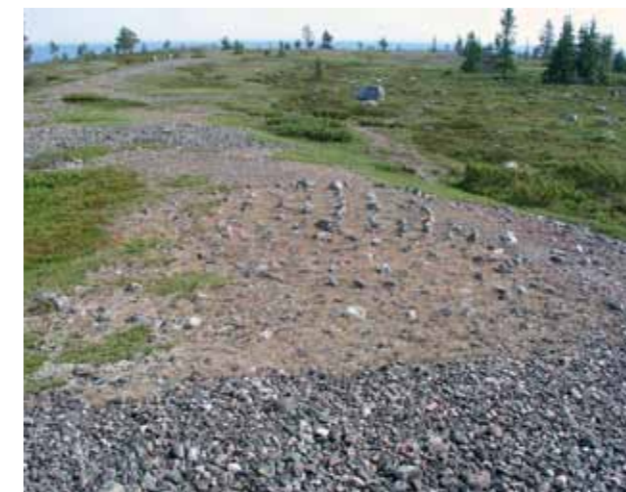
På åsen ligger labyrinter och tomtningar på rad.

Stensötan (Polypodium vulgare) är en ormbunke vars sötaktiga och lakritsmakande rötter förr såldes på apotek. De användes för att befrämja upphostningar men även som svett drivande och urindrivande medel.